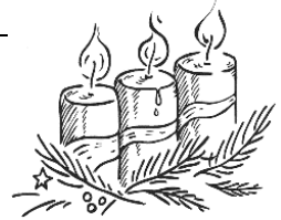
3. Advent: Der Verheißung trauen

Hl. Messe mit dem Konvent Hl. Messe Familienmesse mit Kommunionkindern Lateinisches Hochamt