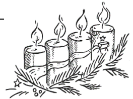
4. Advent: Dem Licht folgen